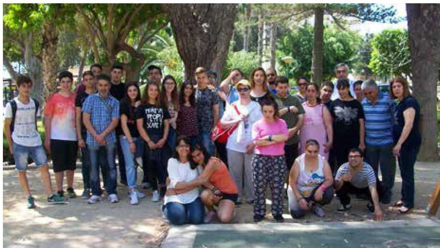
Τον δημόσιο κήπο επισκέφθηκαν οι μαθητές και οι μαθήτριες της Σχολής μαζί με μέλη της Πρόσβασης.