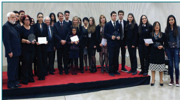
Οι βραβευθέντες στα πλαίσια του διαγωνισμού του προγράμματος εθελοντικής εργασίας «Νεολαία και Εθελοντισμός 2015 - 2016»