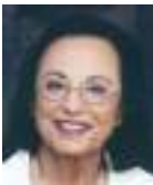
Γράφει: Αλέκα Γράβαρη – Πρέκα

Στην αρχή ήταν ένα μούδιασμα, ύστερα ένα σύννεφο σκοτείνασε τις σκέψεις. Σφίξιμο στο στομάχι, πάει ο ύπνος, έμπειρος δύτης, εσύ, σε ωκεανούς βιβλίων, νάσου ο τίτλος: «Η πανούκλα». Στο εξώφυλλο το βαθύ στοχαστικό βλέμμα ενός σύγχρονου διανοητή: Αλμπέρ Καμύ (Albert Camus), τιμημένος με Νόμπελ, χαμένος στα 47 του σε αυτοκινητικό δυστύχημα.