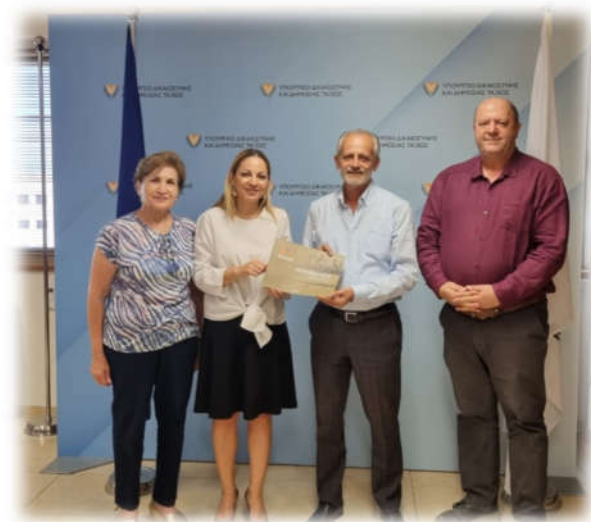
Συνάντηση με την Υπουργό Δικαιοσύνης και Δημόσιας Τάξεως, Άννα Κουκκίδη-Προκοπίου