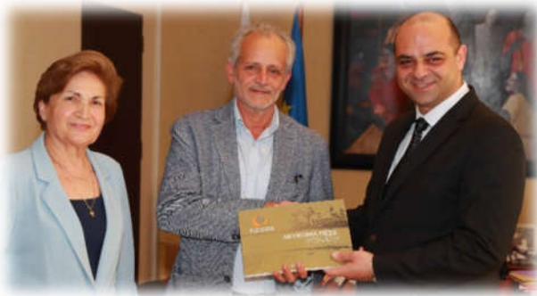
Συνάντηση με τον Υπουργό Εργασίας και Κοινωνικών Ασφαλίσεων, Γιάννη Παναγιώτου