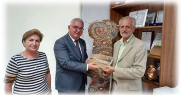
Συνάντηση με τον Ειδικό Αντιπρόσωπο της Γενικής Συνέλευσης του ΟΑΣΕ για την Κοινωνία των Πολιτών, Κυριάκο Χατζηγιάννη