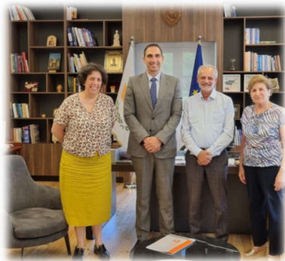
Συνάντηση ΠΣΣΕ με τον Υπουργό Εσωτερικών, Κωνσταντίνο Ιωάννου