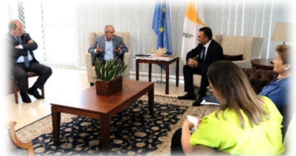
Συνάντηση με τον Υπουργό Άμυνας Μιχάλη Γιωργάλλα