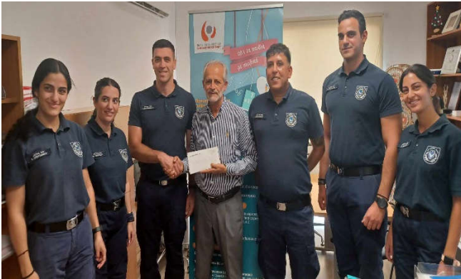
ΣΠΟΥΔΑΣΤΕΣ ΑΣΤΥΝΟΜΙΚΗΣ ΑΚΑΔΗΜΙΑΣ ΒΑΣΙΚΗΣ ΣΕΙΡΑΣ 153