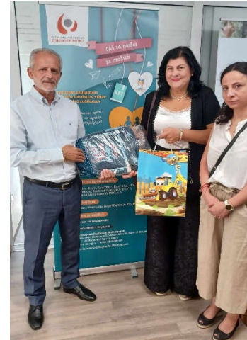
ΔΙΚΗΓΟΡΙΚΟ ΓΡΑΦΕΙΟ ΓΙΩΡΓΟΣ Ζ. ΓΕΩΡΓΙΟΥ