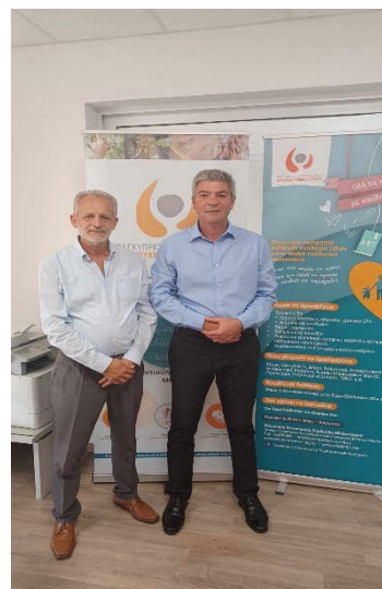
Συνάντηση με τον Γενικό Διευθυντή του Υφυπουργείου Κοινωνικής Πρόνοιας