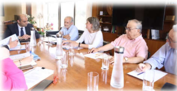
Συνάντηση Συντονιστικού Σώματος Βουλής των Γερόντων με τον Υπουργό Εργασίας και Κοινωνικών Ασφαλίσεων