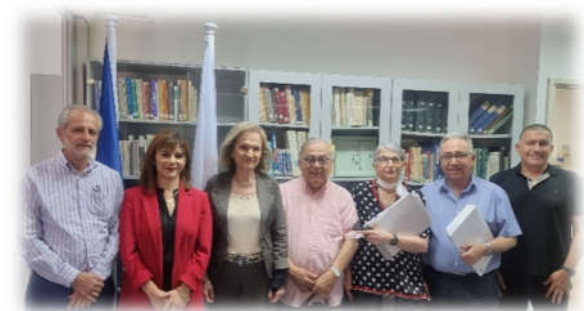
Συνάντηση Συντονιστικού Σώματος Βουλής των Γερόντων με την Υφυπουργό Κοινωνικής Πρόνοιας, Μαριλένα Ευαγγέλου