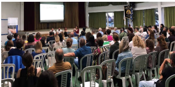
Εκδήλωση «Έγκαιρη παρέμβαση: Εφηβεία και ουσίες»

Νοιαζόμαστε πραγματικά για το πώς ο κάθε άνθρωπος και το άμεσό του περιβάλλον διαχειρίζεται το θέμα της εξάρτησης. Στόχος μας είναι να συμπληρώσουμε με έμπρακτο και αποτελεσματικό τρόπο κενά της κοινωνίας στον τομέα των εξαρτήσεων, καθώς και να γεφυρώσουμε δρόμους μεταξύ των ατόμων που κάνουν χρήση ή/και παρουσιάζουν εξαρτητικές συμπεριφορές του περιβάλλοντός τους.