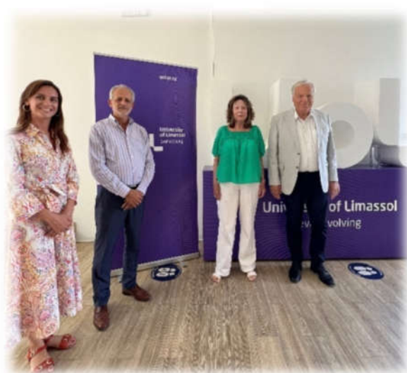
Υπογραφή Μνημονίου Συνεργασίας με το Πανεπιστήμιο Λεμεσού