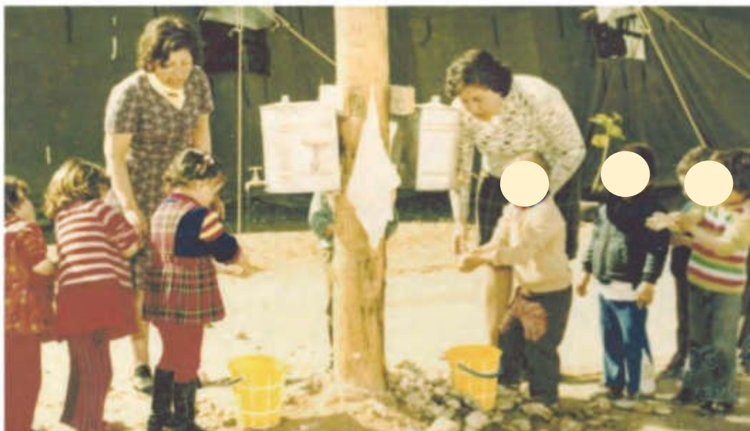
Το νηπιαγωγείο 'MANA' σε αντίσκηνο στον καταυλισμό Σταυρού μετά την Τουρκική εισβολή, 1974

«Η δράση των εθελοντικών οργανώσεων/εθελοντών κατά και μετά την τουρκική εισβολή»