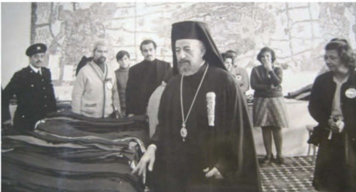
Ο Αρχιεπίσκοπος Μακάριος επισκέπτεται την ομάδα του Κυπριακού Ερυθρού Σταυρού που υποδεχόταν πρόσφυγες στη Ξενοδοχειακή Σχολή το 1974

Ἀντίγραφα, τοῦ ἐντύπου διατίθενται εἰς τὰ Γραφεῖα τῆς Ἐπιτροπῆς, (Ἐκκλησία Ἁγίου Δημητρίου, Ἀκρόπολις, Λευκωσία) καὶ τοῦ Παγκυπρίου Συμβουλίου Εὐημερίας, (ὁδὸς Βουλγάρη ἀρ. 2, Λευκωσία) καθὼς ἐπίσης εἰς τὰ κατὰ τόπους Ἐπαρχιακὰ Γραφεῖα Εὐημερίας.