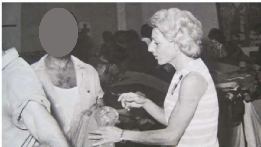
Βοήθεια κατά την επιστροφή των αιχμαλώτων της τουρκικής εισβολής το 1974 Κυπριακός Ερυθρός Σταυρός