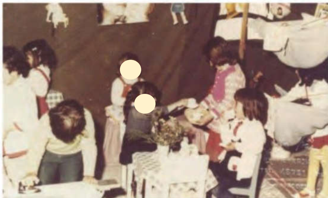
Το αντίσκηνο λειτουργούσε το πρωί σαν νηπιαγωγείο, 1974 Σωματείο Ελληνίδων Κυριών 'MANA'