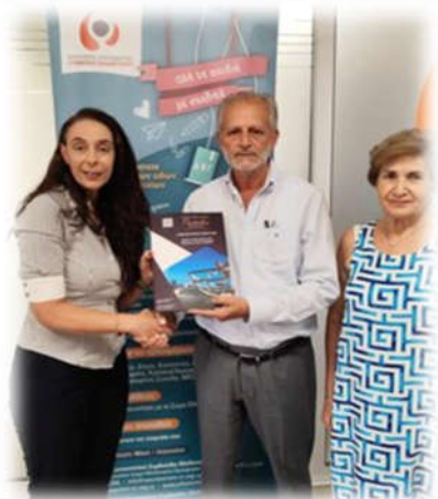
Ίδρυμα Χαράλαμπος και Έλενα Παττίχη

Παράδοση των ειδών από εκπροσώπους του ΠΣΣΕ και της Ελληνικής Τράπεζας σε εκπροσώπους των σχολείων