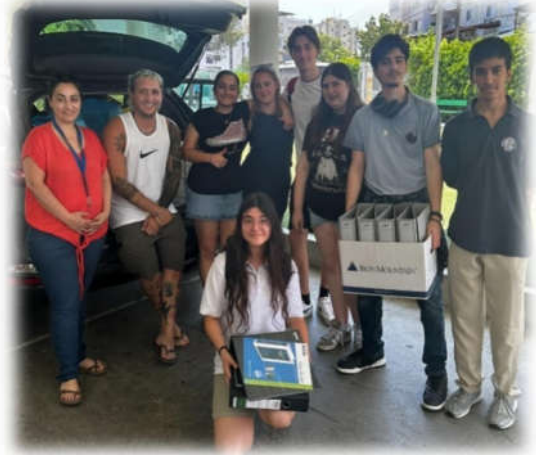
American International School in Cyprus