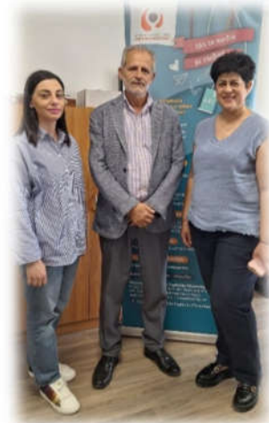
Βιβλιοθήκη Πανεπιστημίου Κύπρου