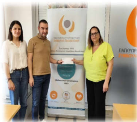
HLB CYPRUS ADVISORY AND ACCOUNTING