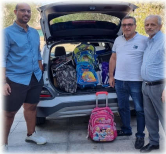
Κίνηση ΔΗ.ΑΝ.Α Δασκάλων-Νηπιαγωγών-Ειδικών Εκπαιδευτικών