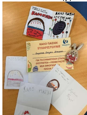
Δημοτικό Σχολείο Σταυρού