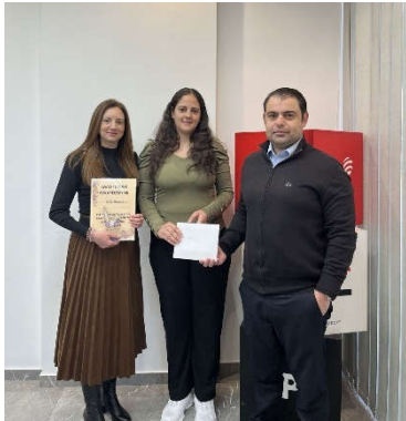
SPL Audit (Cyprus) Ltd