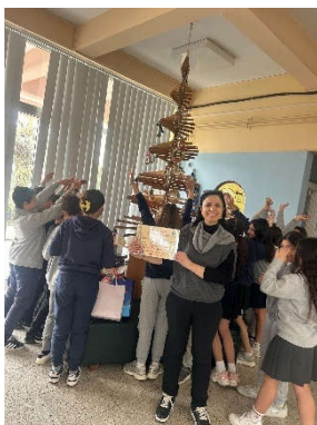
Α' Δημοτικό Μακεδονίτσας