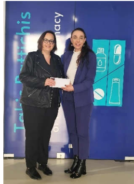
Ίδρυμα Χαράλαμπος & Έλενα Παττίχη