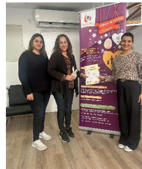
Ροταριανός Όμιλος Λευκωσία-Σαλαμς