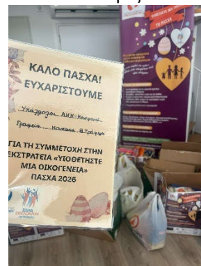
Υπάλληλοι κεντρικών γραφείων ΑΗΚ